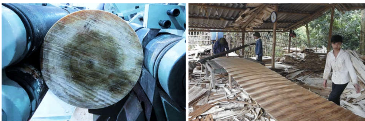
Hình 4. Bóc ván mỏng bằng máy không trục chấu và băng ván mỏng

Theo phương pháp tính toán tương đương này, nếu gọi đường kính khúc gỗ đã gọt tròn là d , đường kính lõi gỗ sau bóc ván mỏng là d_1 , chiều dày ván mỏng là s , ta có: