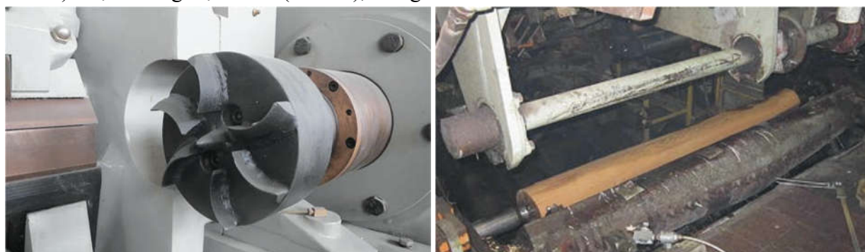
Hình 3. Trục chấu và máy bóc ván mỏng có trục chấu

nhiều trường hợp sử dụng máy bóc không chấu để bóc lại những lõi gỗ bóc (đường kính lõi gỗ khoảng 70 - 150 mm) từ máy bóc có trục chấu. Do vậy, chúng tôi đề xuất phương pháp tính toán chiều dài băng ván mỏng tương đương, gần đúng bằng cách coi quỹ đạo của dao cắt (chính bằng chiều dài băng ván mỏng) bằng tổng chu vi các đường tròn đồng tâm cách nhau liên tiếp có đường kính lớn hơn nhau đúng bằng chiều dày ván mỏng.