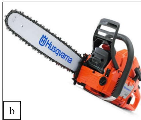
Hình 2. Hình ảnh hiện trường nghiên cứu và loại cưa được sử dụng để nghiên cứu a) Hiện trường nghiên cứu; b) Loại cưa được sử dụng để nghiên cứu Husqvarna 365