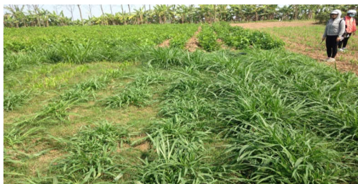
Hình 1. Mô hình trồng ngô, cỏ sữa, đậu tằm tại xã Yên Lạc

Cây trồng chủ yếu là ngô, cỏ sữa, đậu tằm, được trồng phổ biến ở những khu vực ven sông Hồng. Nhìn chung, cây sinh trưởng và phát triển nhanh.