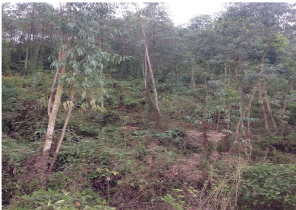
Hình 3. Mô hình rừng trồng bạch đàn tại xã Điều Lương

độ tuổi 4, mức độ sinh trưởng trung bình, độ tàn che hiện tại của tầng cây cao là 0,4, độ che phủ của cây bụi thảm tươi dưới tán là 95%.