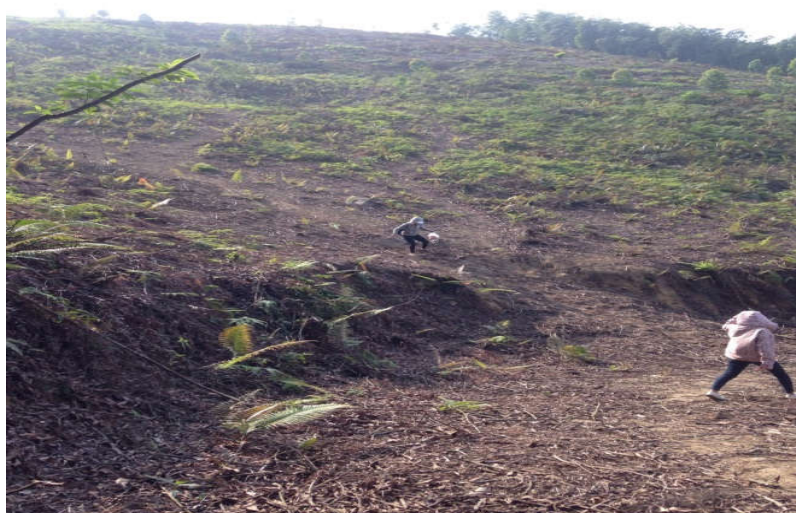
Hình 5. Đất trồng sau khai thác trắng tại xã Chương Xá

mòn bề mặt, nhiều đá lẫn xuất hiện trên tầng canh tác chính.