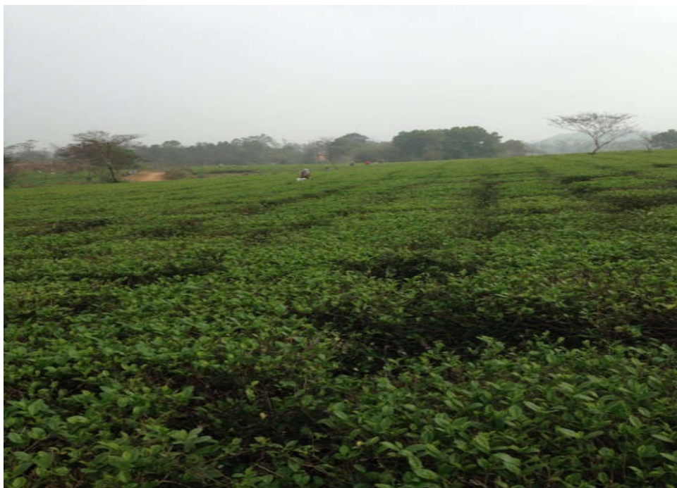
Hình 2. Mô hình trồng chè tại xã Điều Lương