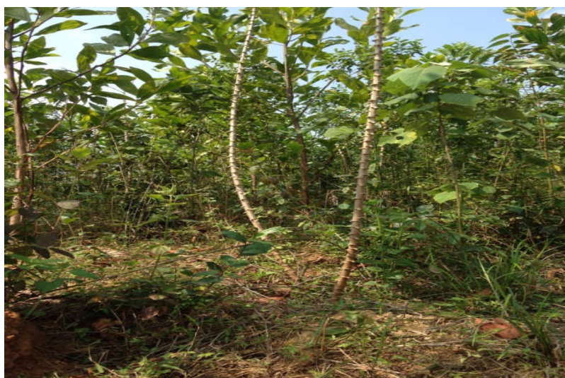
Hình 4. Mô hình trồng keo - sắn tại xã Yên Dương